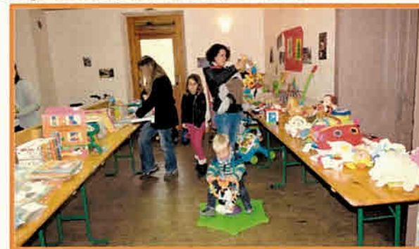
Bourse aux jouets (Le club des Marmottes)