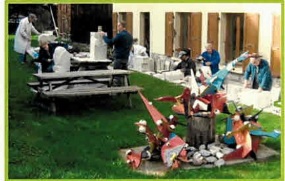
Stage de sculpture Artistes en Herbe