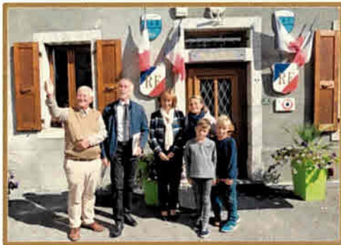
Rencontre avec Monsieur le Sous-Préfet