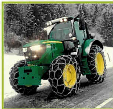
Nouveau tracteur pour déneigement