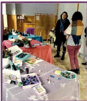
Initiation aux huiles essentielles