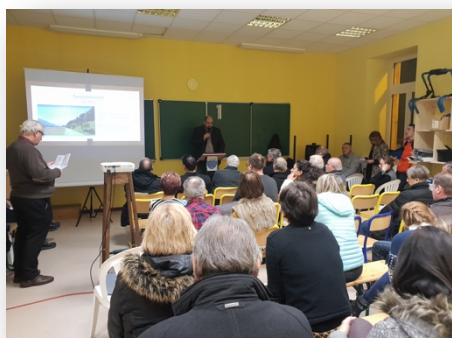
Vœux du Maire 02/2019