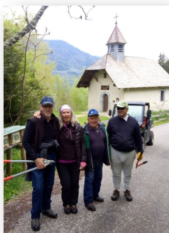
Journée de l'environnement (Loisirs et Partages) 05/2019