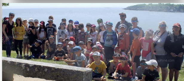
Voyage des 41 écoliers à Moelan sur mer 06/2019