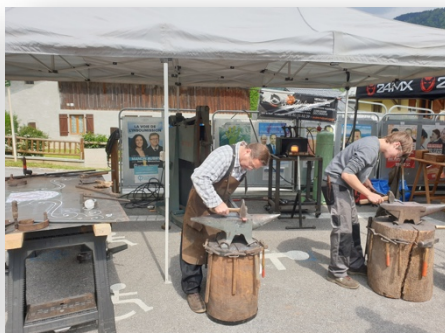
Fête du village 06/2019