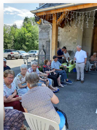
Apéritif des anciens combattants 06/2019