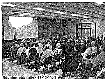
Réunion publique - 17-10-11, Tliy

Dans un premier temps, la sensibilisation des propriétaires forestiers s'est traduit par la mise en place de réunions d'information à destination des élus et des propriétaires forestiers privés ( Plus de 400 propriétaires forestiers ont répondu présents ).