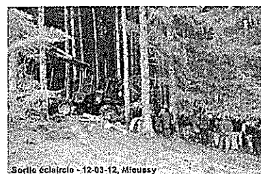
Sortie éclaircie - 12-03-12, Mieussy

Nous rappelons qu'il existe en plus des conseils forestiers gratuits, des aides financières pour les travaux forestiers et pour la réorganisation foncière.